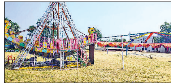
महेन्द्रगढ़। आयोजित होने वाले मेले की तैयारी करते हुए।

टीम ने प्रथम, आरपीएस इंटरनेशनल स्कूल कनीना की टीम ने द्वितीय, आरपीएस स्कूल महेन्द्रगढ़ की टीम ने तृतीय व बीआर पब्लिक स्कूल बाछोद की टीम ने सात्वन्वा स्थान प्राप्त किया। प्रश्नोत्तरी तृतीय गुप प्रतियोगिता की आरपीएस स्कूल की टीम ने प्रथम, यदुवंशी शिक्षा निकेतन स्कूल की टीम ने द्वितीय, रामचंद्र पब्लिक स्कूल कनीना की टीम ने तृतीय व हैप्पी ऐचरवीन स्कूल महेन्द्रगढ़ की टीम ने सात्वन्वा स्थान प्राप्त किया। प्रश्नोत्तरी चतुर्थ गुप प्रतियोगिता की आरपीएस स्कूल महेन्द्रगढ़ की टीम ने प्रथम, आरपीएस स्कूल कनीना की टीम ने द्वितीय, एमएलएस डीएवी स्कूल की टीम ने तृतीय व अरवाली इंटरनेशनल स्कूल महेन्द्रगढ़ की टीम ने सात्वन्वा स्थान प्राप्त किया।