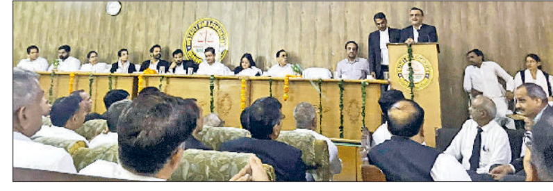
नारनौल। कार्यक्रम में अधिवक्तकों को संबोधित करते हुए।