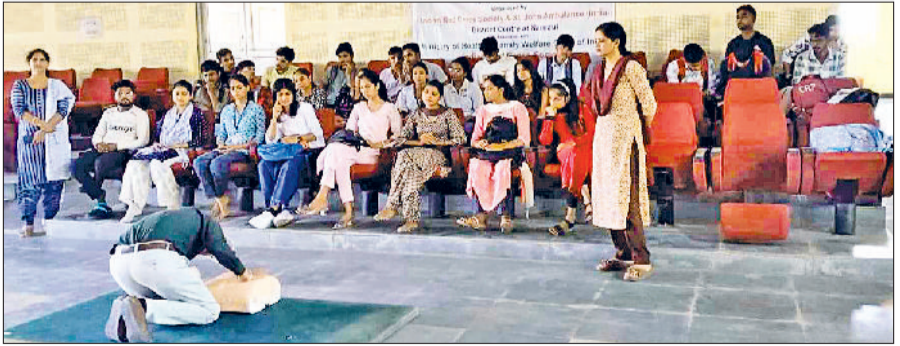
महेन्द्रगढ़। छात्राओं को प्रशिक्षण देते हुए।