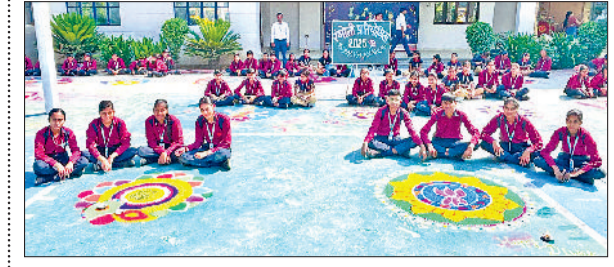
नारनौल। रंगोली बनाते विद्यार्थी।

विकास हो रहा है। सरकार विश्व स्तरीय आधारभूत संरचना के निर्माण के लिए दृढ़ संकल्पित है। हरियाणा का सम्पूर्ण विकास राष्ट्र के व्यापक विकास के लिए जरूरी है। वर्ष 2047 तक विकसित भारत के सपने को साकार करने में हरियाणा की अहम भूमिका रहेगी।