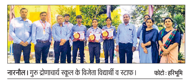
नारनौल। गुरु द्रोणाचार्य स्कूल के विजेता विद्यार्थी व स्टाफ।

बैंक प्रबंधकों के साथ बैठक में बैंक व एटीएम में सुरक्षा व्यवस्था को लेकर चर्चा की गई। सुरक्षा व्यवस्था के तहत बैंक परिसरों और एटीएम बूथों पर उच्च गुणवत्ता वाले सीसीटीवी कैमरे हों तथा यह सुनिश्चित करने पर जोर दिया गया कि वे हर समय कार्यरत रहें। फुटेज का नियमित रूप से निरीक्षण किया जाए। इसके अतिरिक्त सभी बैंक शाखाओं व एटीएम में एक त्वरित प्रतिक्रिया अलार्म प्रणाली को सक्रिय रखने का निर्देश दिया गया, ताकि किसी भी आपात स्थिति में स्थानीय पुलिस स्टेशन को तुरंत सूचित किया जा सके। बैंकों को नकली जमा करने, निकालने के दौरान मानक सुरक्षा प्रोटोकॉल का सख्ती से पालन करने तथा सदिग्ध गतिविधियों पर तुरंत रिपोर्ट करने को कहा।