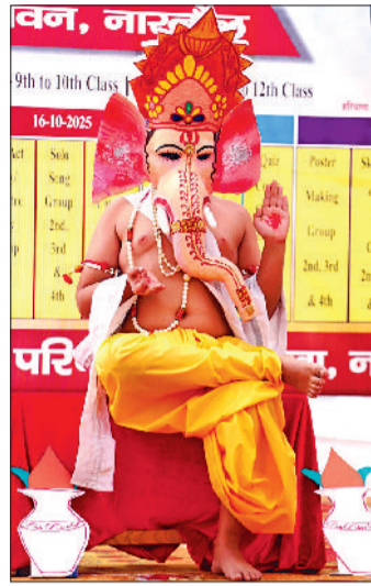
नारनौल। प्रतियोगिताओं में भाग लेते छात्राएं।